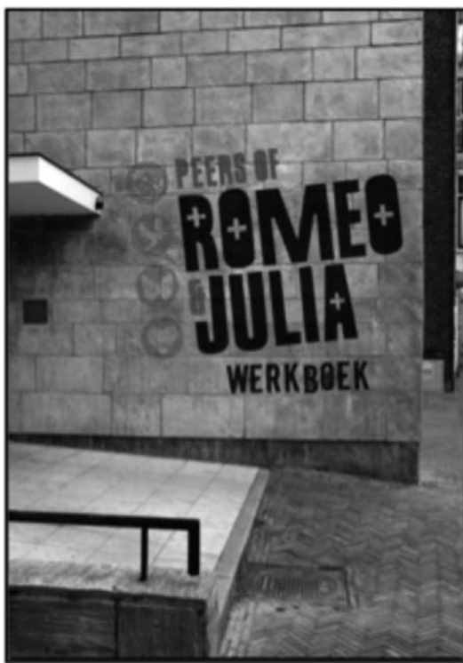
Handleiding voor leerkrachten en werkboek voor leerlingen