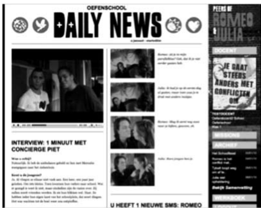
Dag 1 – Het schoolfeest

De verhaallijn wordt bepaald door de keuzes die leerlingen maken en ontvouwt zich in dagelijkse kranten online middels filmpjes, foto's, nieuwsberichten, interviews en columns. Leerlingen en leraren kunnen deze dagkranten bekijken op hun persoonlijke account op de website.