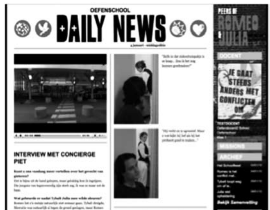
Dag 2 – Het ziekenhuis