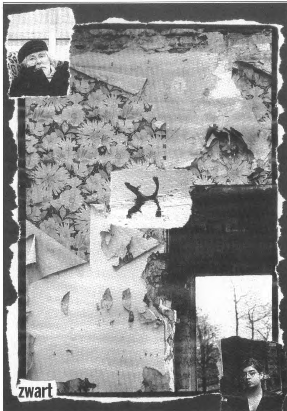
Collage n.a.v. een fragment uit 'Water van zout' van Bettie Elias