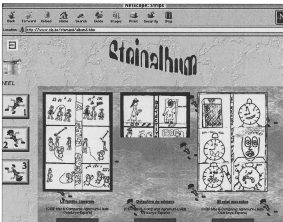
EN BLAD UIT ONS ALBUM

Deze fase bestaat uit het verder benutten van de enorme mogelijkheden van Internet. Omdat de strips van de leerlingen op onze website worden geplaatst, verwachten we reacties van andere scholen uit binnen- en buitenland. Die reacties kunnen allerlei vormen aannemen. De documentatie en de pasklare sjablonen (zie boven) worden ook via e-mail verstuurd (in het Engels of in het Nederlands) naar diverse basisscholen over heel de wereld. Dit maakt het bijvoorbeeld mogelijk dat andere kinderen met onze stripfiguren nieuwe verhalen gaan maken, een vervolg schrijven op de al aanwezige strips, enzovoort.