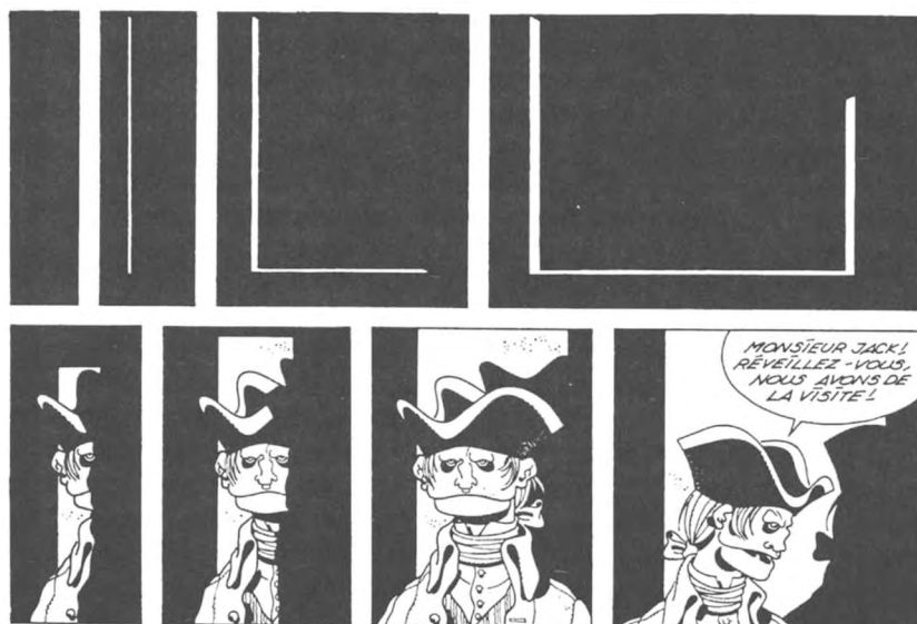
Afbeelding 4 : Comès : Eva

De overtuiging dat een goed stripverhaal niet alleen een goed verhaal moet zijn, maar ook iets hoort toe te voegen aan het genre van de strip - zoals een werkelijk goede roman ook de wereldliteratuur moet verrijken - zegt iets over de lezer. Het merendeel van de striplezers leest een stripverhaal alleen om het verhaal en dat is jammer. Dat de succesformule van steeds weer dezelfde