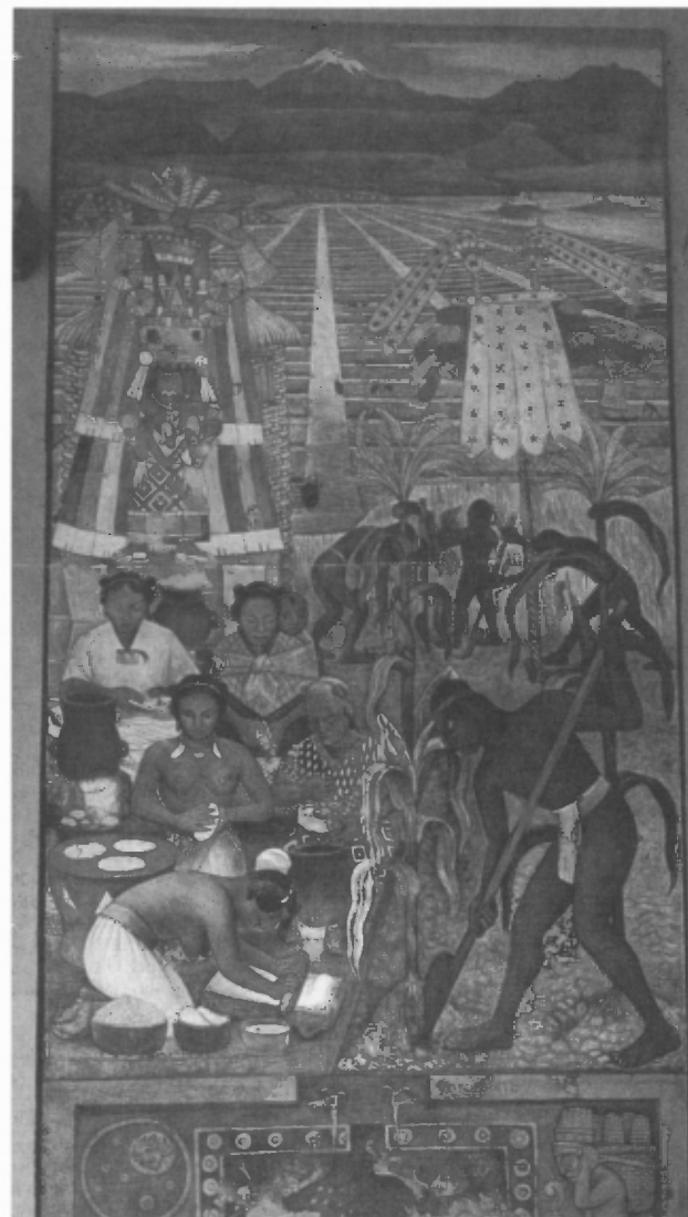
De Huastecse beschaving (Diego Rivera)

onderwijs. Begiftigd met een heldere visie op de toekomst van zijn land deed Vasconcelos een beroep op Mexicaanse kunstenaars om mee te werken aan de wederopbouw van het land. Hij vond