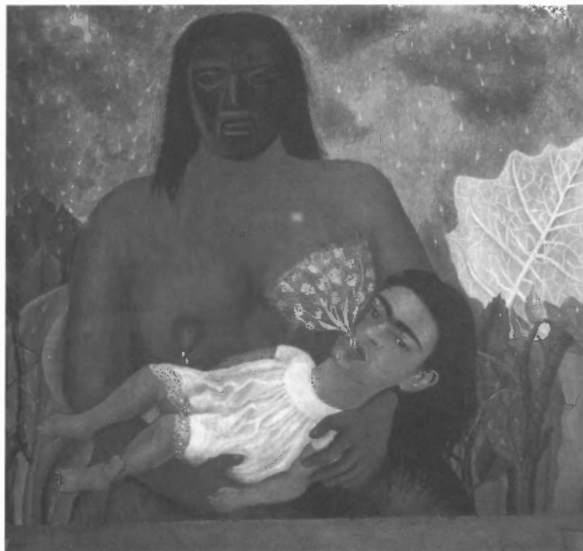
Frida Kahlo in de armen van haar min

ne Helen Wills Moody. Bovendien raakte hij geïnspireerd door het op de vooruitgang gerichte bruisende klimaat in de Verenigde Staten. In 1930 ging het echtpaar voor een jaar terug naar Mexico, waarna een nieuw verblijf in de VS volgde. Rivera kreeg de gelegenheid om zijn werk tentoon te stellen in het Museum of Modern Art in New York. Bovendien kreeg hij opdracht de muren te beschilderen van het Kunstinstituut van Detroit. Tot slot werd hij door de Rockefeller gevraagd om de muren van de hal van het gebouw van de Radio Corporation Arts te beschilderen. Deze eervolle opdracht zou leiden tot Rivera's ondergang in de VS. Er ontstond een conflict doordat Rivera de beeltenis van Lenin prominent op de voorgrond schilderde. Uiteindelijk leidde deze affaire tot een verbreking van