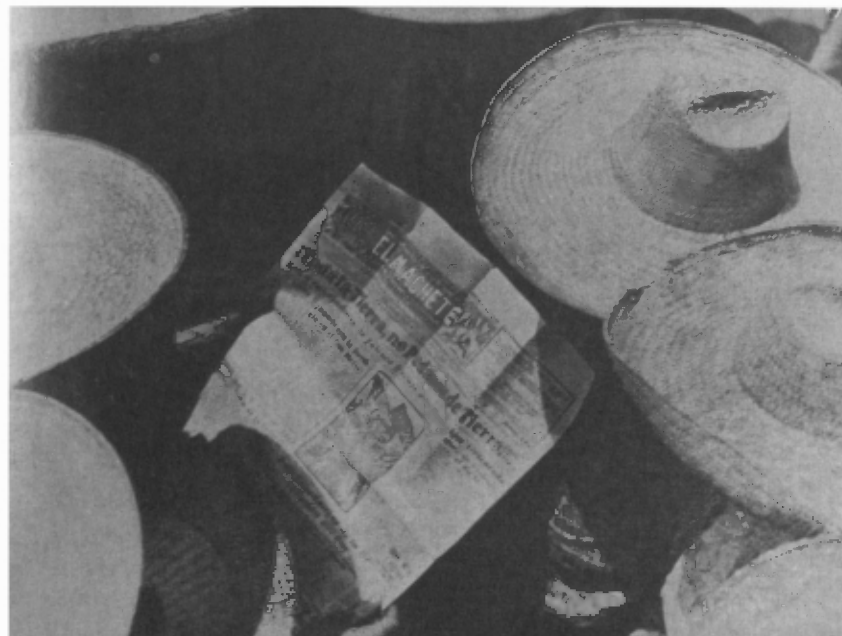
Arbeiders lezen El Machete