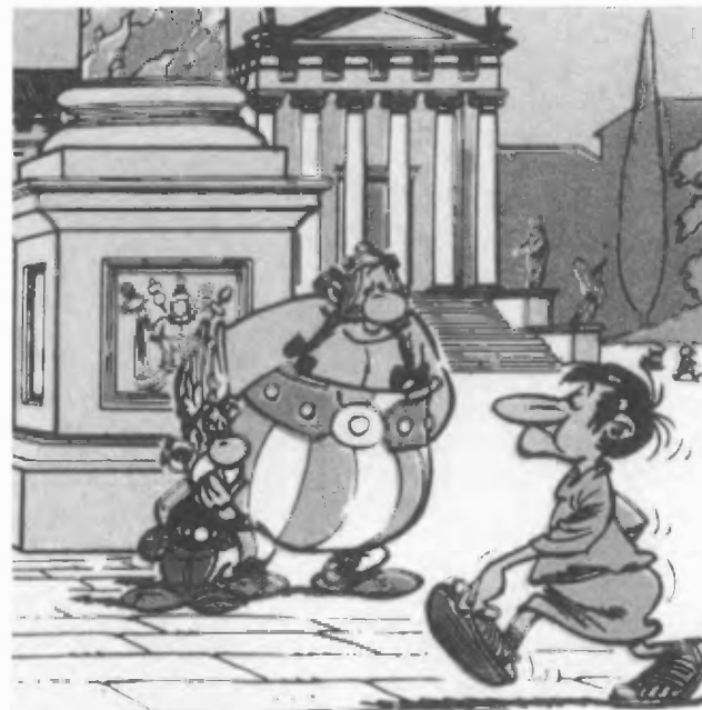
Asterix en Obelix zien een Romein passeren

Bij de voorwaarden hoort ook dat iedereen een aandeel levert aan de door de leerlingen gemaakte reisgids. Zij kunnen kiezen uit monumenten, kerken et cetera, die bezocht zullen worden. Bij deze onderwerpen geef ik