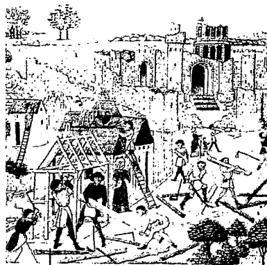
7 De bouw van een nieuwe stad.

De handel tussen stad en platteland groeide snel. Er kwamen meer en grotere steden. Er was verstedelijking. Toch woonden de meeste mensen nog op het platteland. Zij hadden de stad wel voor allerlei dingen nodig. Er kwam een 'agrarisch-stedelijke' samenleving. De meeste mensen in zo'n samenleving waren boer, maar steden waren wel erg belangrijk voor ze. 6 7 8