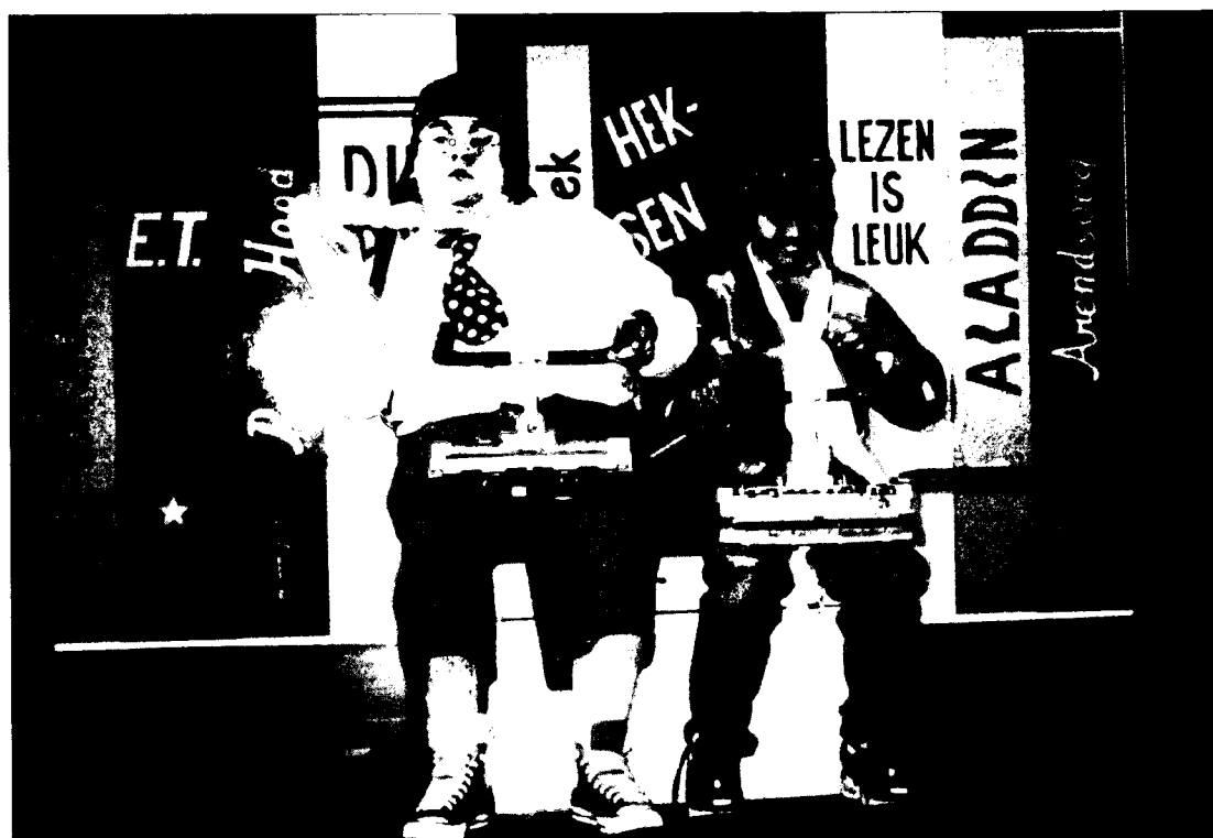
Afbeelding 2: Samen een noodlanding maken.

bleef achtervolgen was hoe het toch kan dat er op middelbare scholen zoveel taalachterstand is. Onze conclusie was dat het taalprobleem al op een veel jongere leeftijd ontstaat en dat het daarom belangrijk is deze problematiek bij de wortels aan te pakken. Het maken van een toneelstuk voor beginnende lezers (groepen 3, 4 en 5) was voor Lawine dus een logische volgende stap. Een project werd gestart en na een positief advies van stichting Lezen aan het ministerie van OC&W kreeg Lawine subsidie om een stuk te ontwikkelen en om 25 voorstellingen binnen de randstad te verzorgen. Deze vonden plaats op scholen of in bibliotheken en wijkcentra in samenwerking met omliggende scholen.