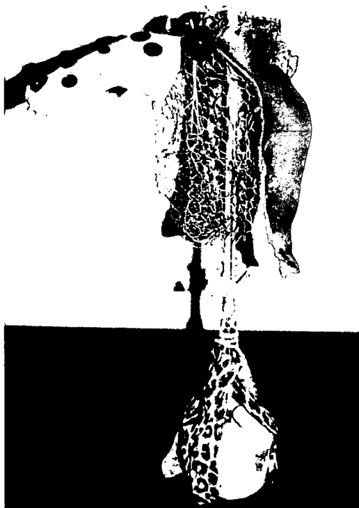
Afbeelding 2: Monster van restmateriaal.

Hierna geeft de leerkracht de opdracht om een eigen beeld te maken. Daartoe wordt teruggegrepen op het verhaal van de koning.