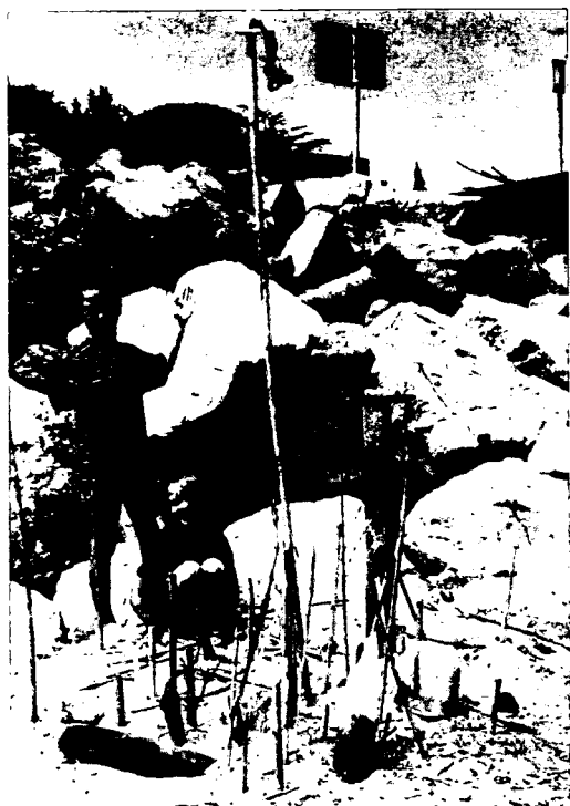
Afbeelding 3: Kunstproject op het strand.

dansvoorstelling naar een dansvoorstelling, van een film naar een film.