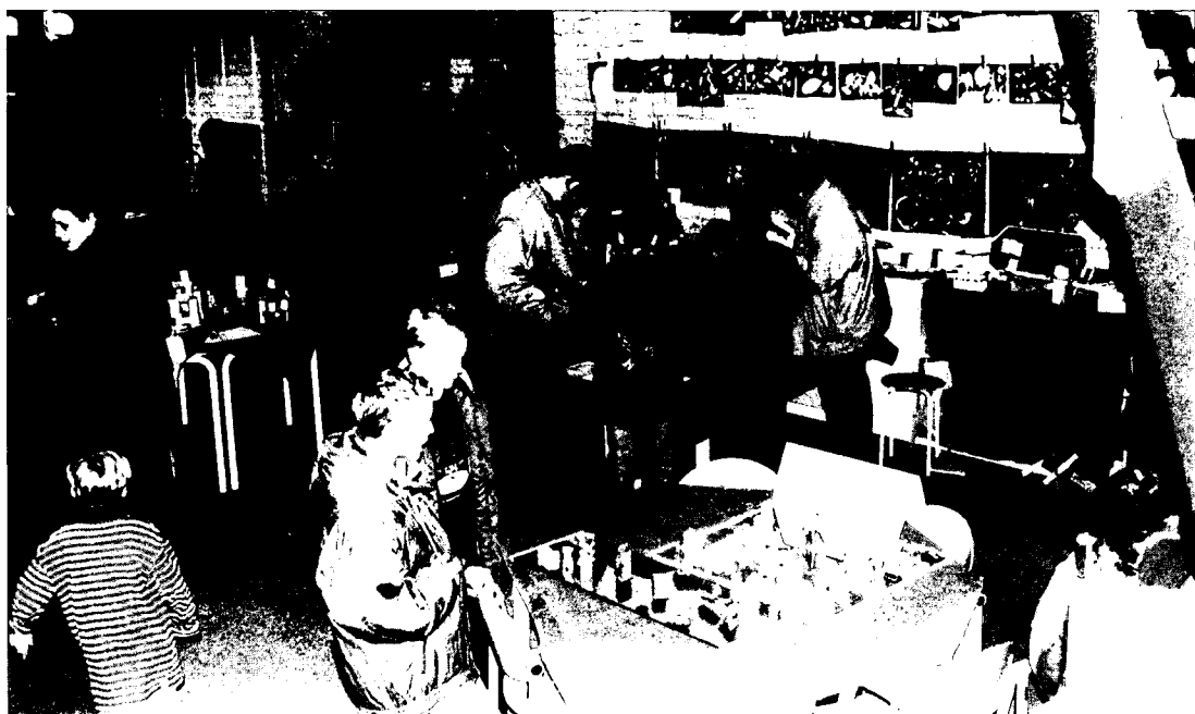
Afbeelding 4: De tentoonstelling was een groot succes.

bij het realiseren van de plannen en hoe gaandeweg collega's en ouders steeds enthousiaster werden.