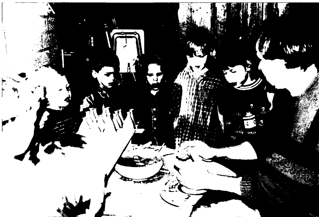
Afbeelding 2: Bezoek aan een kunstenaar door groep 1 en 2.

Dit maakte me nieuwsgierig naar de achtergronden van het project op De Brink, zomaar een basisschool van een dorp in de kop van Noord-Limburg.