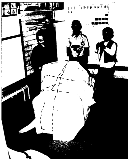
Afbeelding 6: Inpakken à la Christo.

Zo'n project van twee weken komt er niet zomaar en, het is al eerder gezegd, al zeker niet als het gaat om iets als kunst dat hoe dan ook toch als abstracter wordt ervaren dan iets als verre landen, dieren of Sinterklaas. Volgens Katia en Jos is er ook gewoon minder voorbeeldmateriaal op dit gebied, geen lesbrieven, kant-en-klare pakketten of wat dan ook, en dat betekende dat het voorbereiden en uitvoeren van dit project, zeker voor hen als coördinatoren, nog meer tijd kostte dan al bij een 'normaal' project het geval is. Al in de tweede week van het schooljaar, in september, zijn zij met de voorbereidingen begonnen, waarna dus twee maanden met veel extra werk volgden: 'Geen project om elk jaar te doen, eerder iets voor eens in de drie jaar.'