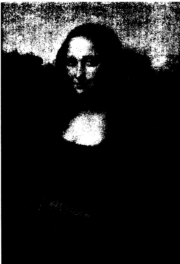
LEONARDO DA VINCI, Mona Lisa , 1503-1506. Het ietwat wazig in elkaar overlappen van donkere en lichte tonen, maar ook van kleuren, was kenmerkend voor Da Vinci. Die techniek werd dan ook door hem uitgevonden of in elk geval sterk verbeterd en in heel Europa overgenomen.

Duchamp beweerde dat voor de Mona Lisa een man model zat. Steeds meer kenners denken dat hij gelijk had.