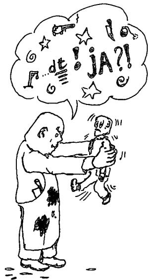
De opleiding tot leraar Nederlands in het MBO

Het is voor iedereen een ingewikkelde situatie: voor de scholen en voor de uitgeverijen. Je moet een nieuwe methode voor een nieuwe onderwijssituatie zien als een goed doordacht voorstel. Dat is de meerwaarde die je als uitgeverij te bieden hebt. Zo'n voorstel werkt alleen als het redelijk aansluit bij de praktijk. Als uitgever kies je voor een bepaalde oplossing: welke modules komen er in een boek en hoe verdeel je de stof over de verschillende delen, hoe gebruik je de didactiek. Je biedt een bepaald scala aan mogelijkheden. De scholen vertalen de keuzes van de uitgever naar de onderwijspraktijk. Zij maken keuzes, selecteren, leggen accenten afhankelijk van de specifieke schoolsituatie. De invloed van de uitgevers lijkt op het eerste gezicht dus vrij groot. Dat verandert wel zodra de situatie is uitgekristalliseerd. Uit de praktijk komen dan wensen en suggesties die de uitgever vervolgens weer verwerkt in een herziene editie of in een volledig nieuwe methode. Boeken maak je uiteindelijk samen met de klant. Dat is de cyclus en zo hoort het ook.