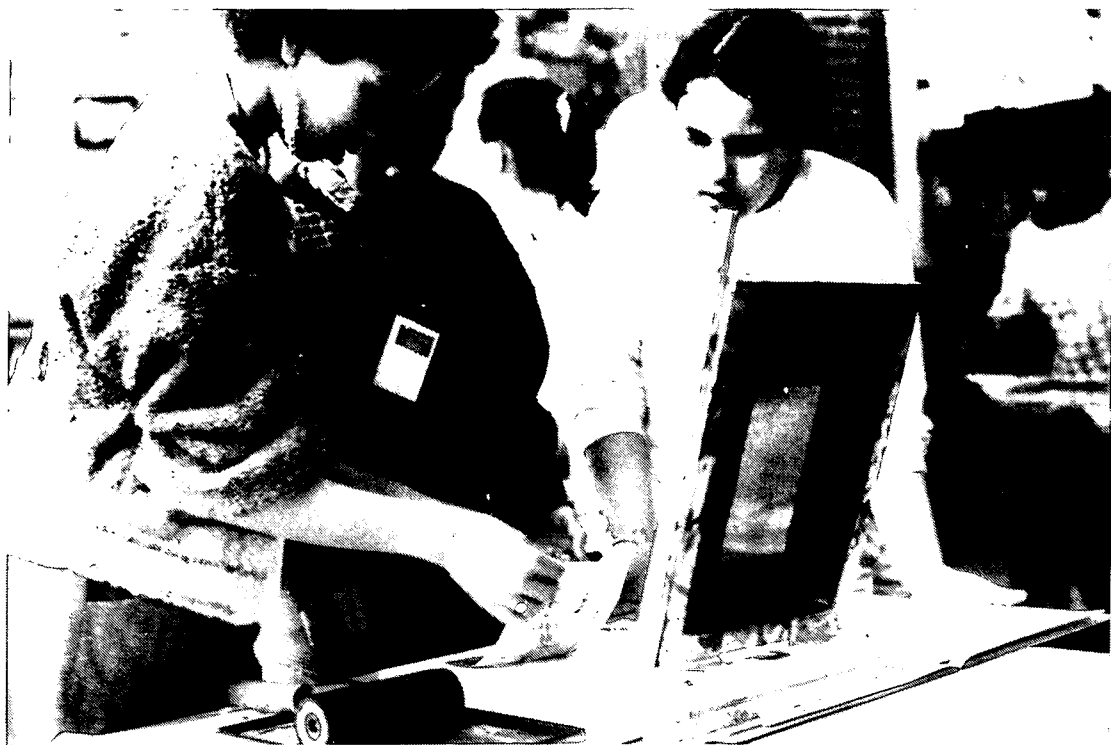
De tekeningen en de gedichten worden gedrukt op de limograaf.