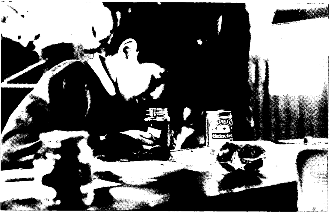
Het onderzoek in de klas. Alles wordt grondig bestudeerd.