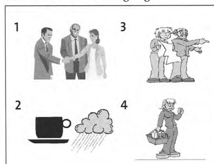
Figuur 4 Voorbeeld uit de spreektoets

Plaatjes illustreren deze thema's in het oefenboek en op het scoreblad. Om te zorgen dat iedere leerder gelijk wordt behandeld zijn de vragen en/of instructies van de toets vastgelegd.