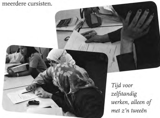
Tijd voor zelfstandig werken, alleen of met z'n tweeën

Na de weekopening is er tijd voor zelfwerkzaamheid . De cursisten gaan aan de gang, individueel, in duo's of kleine groepjes. Om te voldoen aan de verwachtingen moeten bronnen geraadpleegd worden die in de ruimte aanwezig zijn. Bronnen kunnen zowel schriftelijke als digitale bronnen zijn, maar ook medecursisten vormen een bron en pas in laatste instantie de docent. Er wordt dan geoefend met leesteksten, schrijfoopdrachten en gespreksopdrachten die passen bij de diverse verwachtingen rond een cp. Het kan ook gebeuren dat de docent instructiemomenten organiseert met één of meerdere cursisten.