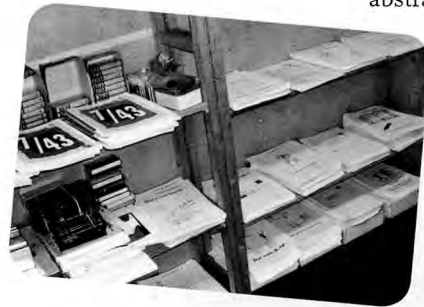
Bronnenkast voor technisch lezen en schrijven

docentonafhankelijk te gebruiken, niet-lineair (dus dat je A niet nodig hebt om B te kunnen doen) en gelaagd. Gelaagd wil zeggen toegankelijk voor cursisten met verschillende niveaus en verschillende leerstijlen en bruikbaar voor verschillende doelen. Om een voorbeeld te geven: in het digitale bronnenmateriaal van het Friesland College zitten leesteksten op niveau A2, die ook voor een Ao-cursist leerzaam zijn. De Ao-cursist kan bijvoorbeeld alleen op de gekleurde woorden klikken, waarbij een foto oppopt en/of hij het woord kan horen. Zo krijgt hij input op zijn eigen niveau, maar kan hij ook al gebruikmaken van de rijkere taalomgeving en eventueel al wat hoger reiken dan op zijn niveau vereist wordt. In Utrecht konden cursisten per verwachting kiezen uit een cp-opdracht op A1-niveau en een op A2-niveau. Vaak namen cursisten beide opdrachten. In het lokaal lagen verder woordenboeken (eenvoudig en moeilijk), fotoboeken, dvd's, audio-cd's, cassette-recorders en concreet materiaal. Voor het technisch lezen en schrijven hadden we een aparte kast met 7/43, klapwoorden, leesboekjes, Alfa Flex , enzovoort. Alle bronnen waren voor de cursist beschikbaar.