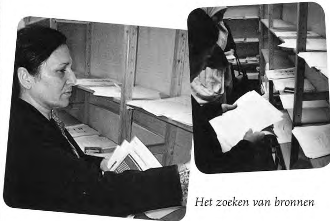
Het zoeken van bronnen

C in zat. Omdat de grote groep was samengesteld uit eerder bestaande groepen konden we op dat moment beschikken over drie docenten voor de hele groep, en dat was heel erg nodig want een docent heeft het razend druk, ook al heeft hij of zij een terughoudende rol in de ogen van de cursist. Elke les begonnen en eindigden we altijd in drie kleine groepen in drie beschikbare lokalen, elk groepje met een docent. Er werd dan gekeken of alle cursisten nog wisten waarmee ze bezig waren of er werden plannen gemaakt voor de werkdag. Na het groepsmoment ging ieder zelfstandig aan de gang.