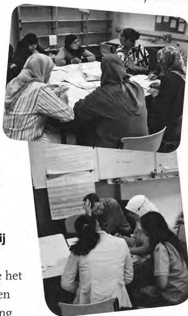
Mentor aan de slag met groepje