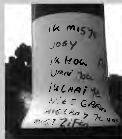
Deze liefdesbetuiging werd gevonden op een lantaarnpaal.