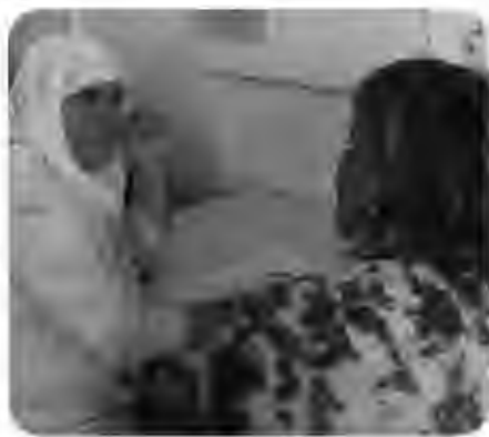
Gesprek met de Nederlandse moeder

ding en voorwerpen uit verschillende landen. De Nederlandse moeders en de buitenlandse moeders waren vast van plan de contacten te onderhouden: op het schoolplein, bij ouderhulp of op de koffie. Eén cursist ging meteen nog een bewijsformulier. Gesprekken in laten vullen, na een lange babbel met de receptioniste van het lesgebouw.