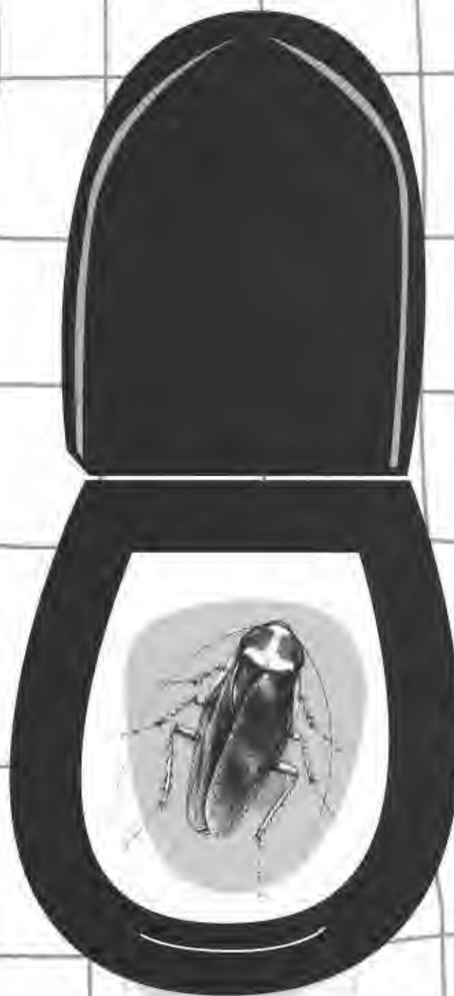
Illustratie Conny van der Neut

Eindelijk komt Ben op de zaal. Met verbrande billen, een gebroken heup en twee gebroken ribben. Sara kan wel huilen van ellende. Het is allemaal haar schuld. Die rotkakkerlak ook.