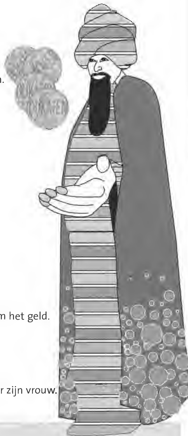
Illustratie: Conny van der Neut

Godja gaat naar zijn vriend. Hij geeft hem de enkelband. 'Breng deze naar de juwelier', zegt hij, 'en vraag 500 dukaten.' De vriend gaat naar de juwelier. 'Wilt u deze gelgel kopen', zegt hij. 'Hij kost 500 dukaten.' De juwelier ziet de enkelband. Hij ziet dat het precies dezelfde is. Hij wil hem meteen hebben. 'Ik krijg er toch 600 dukaten voor', denkt hij. Hij betaalt dus 500 dukaten. De vriend gaat terug naar Godja, en geeft hem het geld. Nu heeft Godja 500 dukaten. Hij geeft zijn vriend 400 dukaten terug. Want die had hij geleend. Nu heeft hij 100 dukaten over. Daarvoor koopt hij een hele mooie gelgel voor zijn vrouw. Maar hij gaat wel naar een andere juwelier.