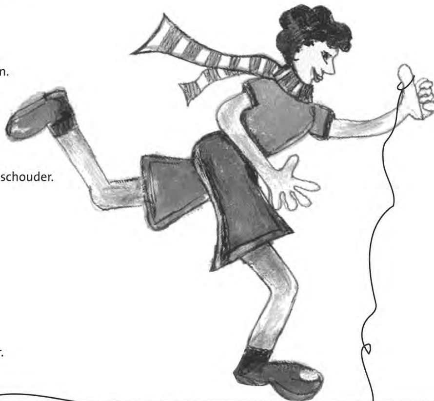
Illustratie: Conny van der Neut

Na een tijdje wordt Hans moe. En hij heeft erge dorst. Daar is een waterput. Hij zet de steen op de rand. Hij buigt voorover. De steen valt - plons - in de put! Hans zegt: 'wat heb ik toch een geluk! Nu hoef ik niets meer te dragen!' Snel loopt Hans naar huis, naar zijn moeder. Zijn moeder is blij dat hij terug is.